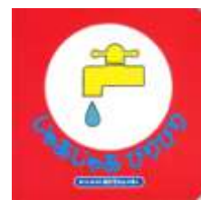
「じゃあじゃあびりびり」