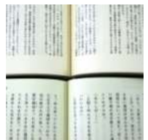
大活字本の1ページあたりの文字数は、単行本の半分以下

別な計らいで制作されているため、利用は視覚障害者の方（手帳の有無は問いません）に限られています。現在は、カセット・テープを再生するための機器が市場から消えていることもあり、CD-ROMでのご提供がほとんどです。棚には並んでいませんが、全国の点字図書館や公共図書館で、お互いに貸し借りをしていますので、ご利用をご希望の際には職員にご相談ください。