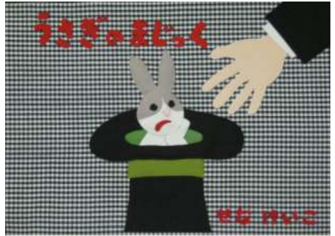
「うさぎのマジック」。絵本とは一味違った紙芝居に仕立てました

手作りの楽しさ、出来上がったときの達成感、仲間との協同作業の充実感など魅力がいっぱいの布絵本作りです。さらに他の方にもこの楽しさを味わってもらいたいと鶴ヶ島ケアホームで年に数回、手作り教室も開いています。